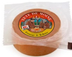
½ Laib Tête de Moine AOP vakuumpackiert