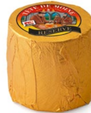
Tête de Moine AOP Réserve Konsumreife: mind. 4 Monate