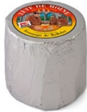
Tête de Moine AOP (Classic) Konsumreife: mind. 75 Tage